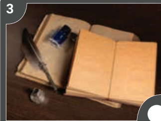
Yaratıcı Yazarlık Projesi