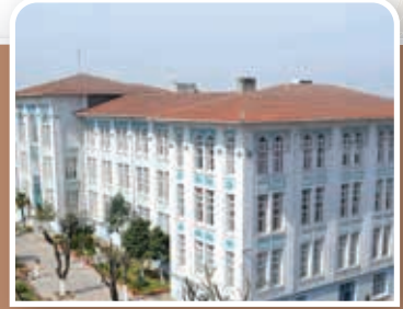
Çapa Fen Lisesi