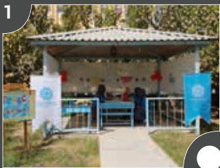
Türk-Afgan Dostluk Evi Projesi

1 a. Görselleri inceleyin. Bu projeler ne hakkındadır? Söyleyin.