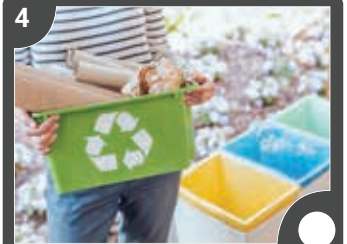
Geri Dönüşüm Projesi