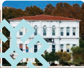
Beşiktaş Atatürk Anadolu Lisesi