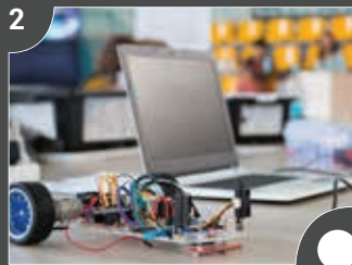
Robotik Kodlama Projesi