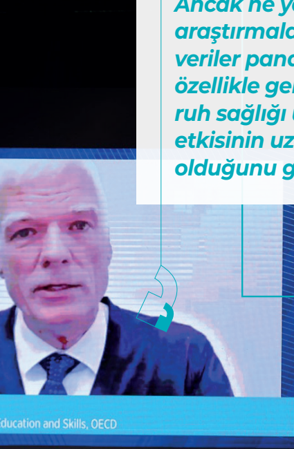
Education and Skills, OECD