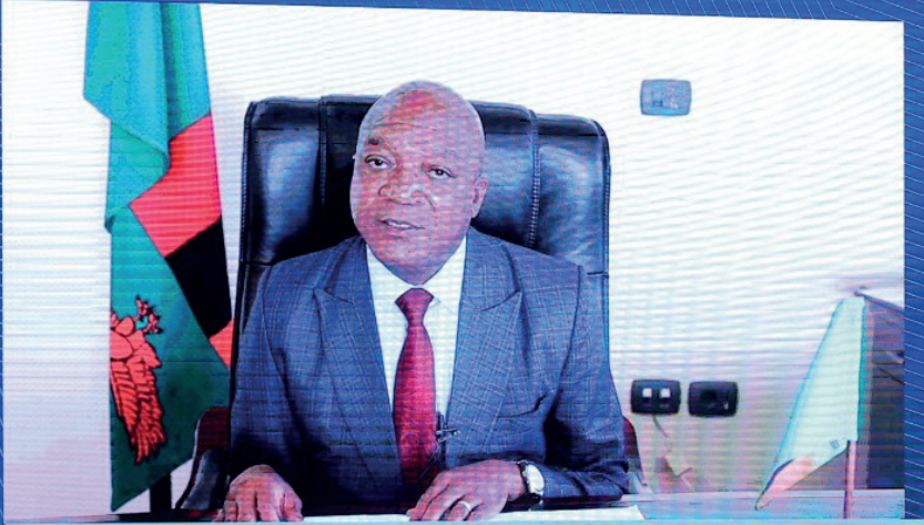
Douglas Syakalima Zambia Minister of Education