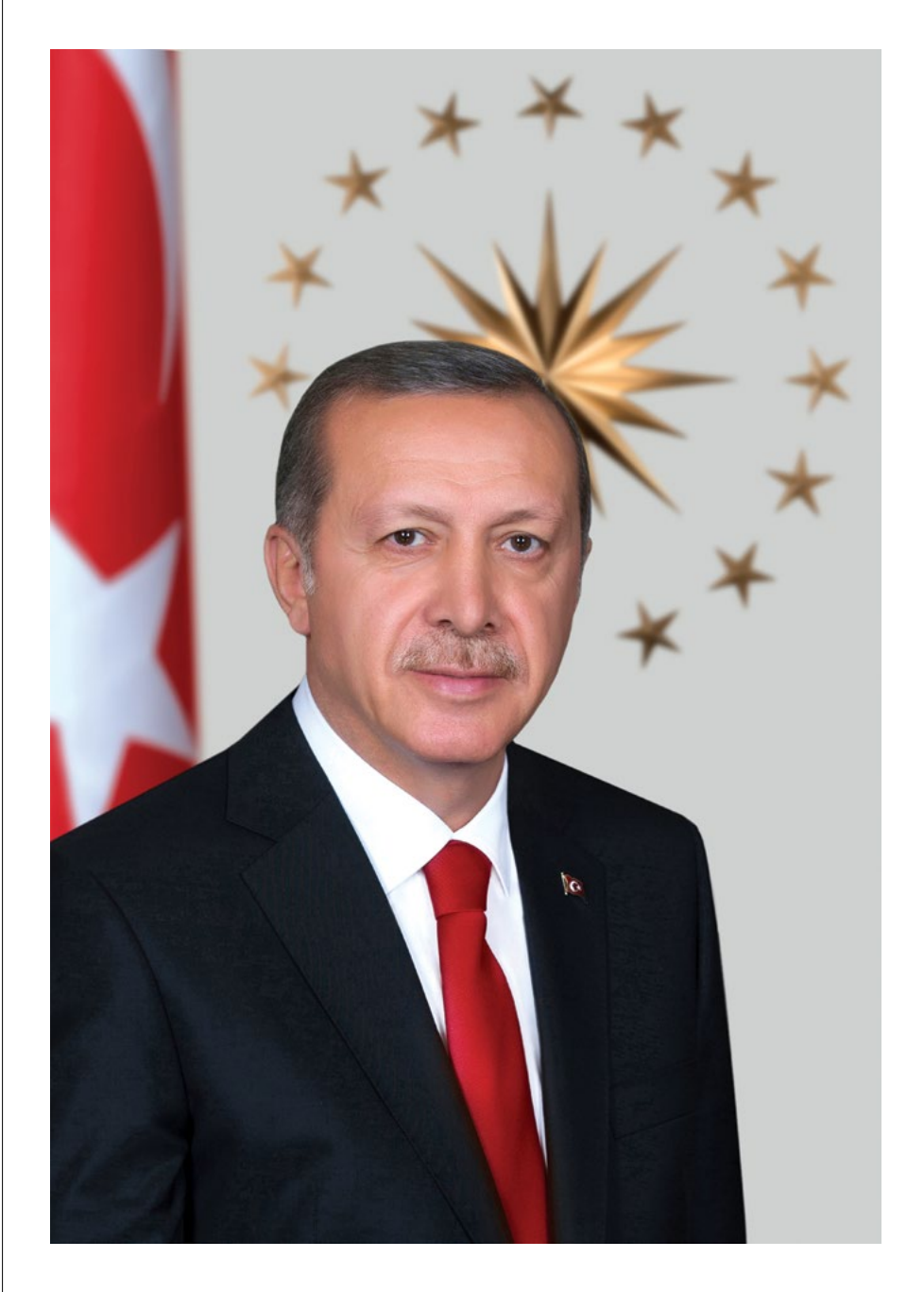
RECEP TAYYIP ERDOĞAN TÜRKİYE CUMHURİYETİ CUMHURBAŞKANI PRESIDENT OF THE REPUBLIC OF TURKEY